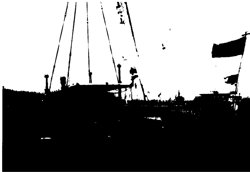
圖 2：瑪麗玫瑰號的抬出，1982 年。

總之，在這篇簡要的文章，我希望已經給您見識到在英國的海洋考古專案項目的一個例子，並且非常感謝您們邀請我來這裡參加您們的論壇。我同意在水下文化遺產領域的合作與交流的重要性，並期待著我們雙方的機構和國家在現在和未來都能合作。